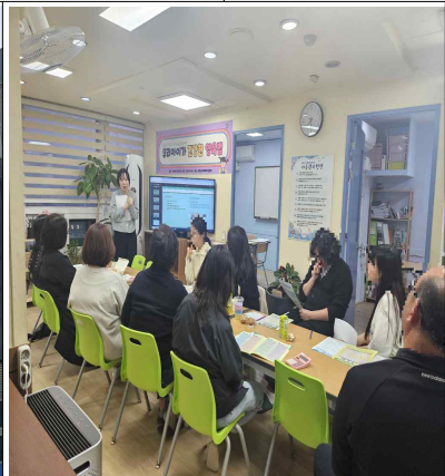
찾아가는 아동학대 예방교육