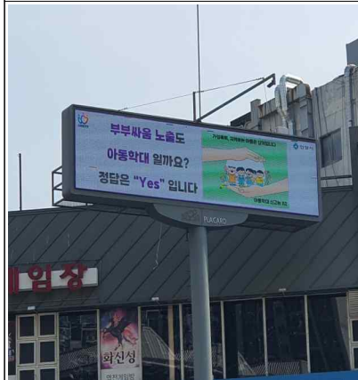
가정의 달 긍정양육 홍보 (2024년)