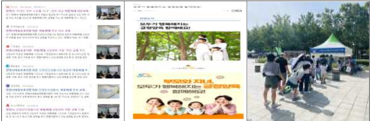
아동학대 부모교육 관련 언론보도