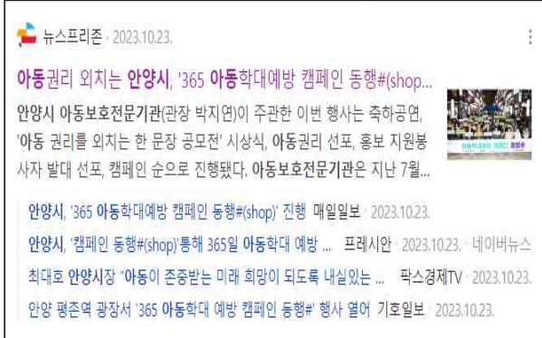
아동학대 예방캠페인 동행# 언론보도