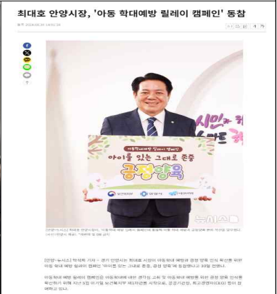
2024년 아동학대예방 릴레이 캠페인