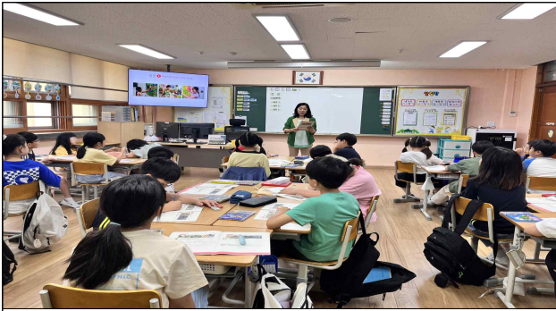
찾아가는 아동권리 교육(아동)