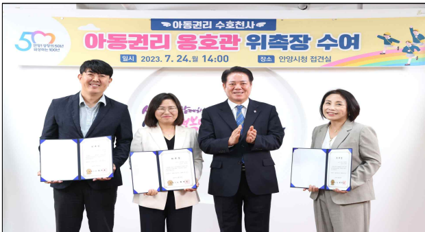
아동권리옹호관 위촉장 수여