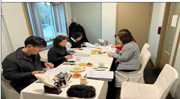
2024년 아동권리옹호관 1차 회의