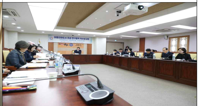
아동친화도시 조성 연구용역 착수보고회