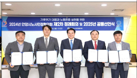
2024년 노사민정 제2차 정례회의 및 공동선언식