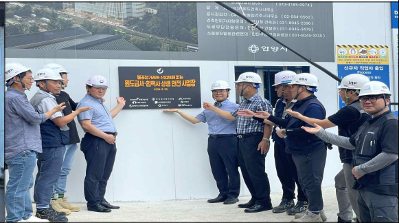
2024년 원도급·협력사 산업재해예방 상생 협약식(1차)