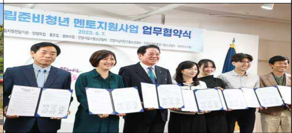
자립준비청년 멘토사업 업무협약식