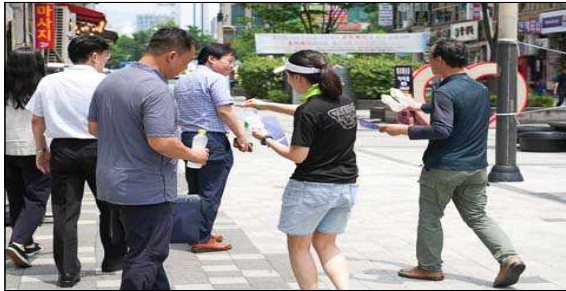
이동노동자 생수나눔 행사