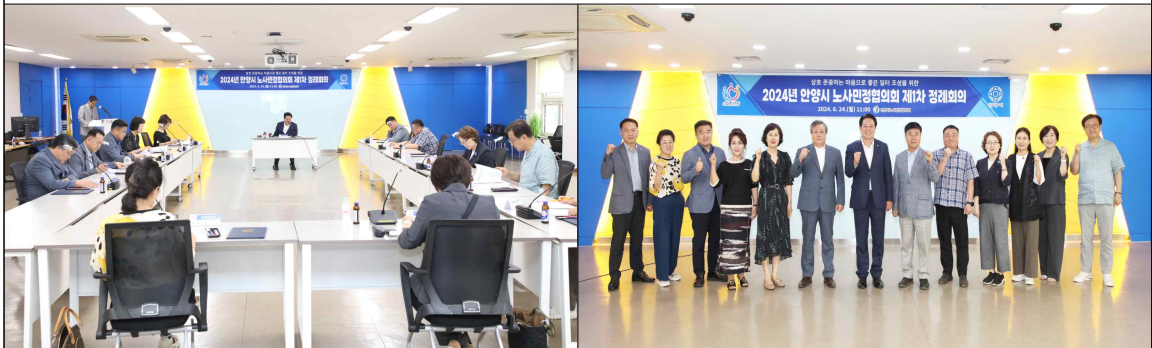
2024년 노사민정협의회 제1차 정례회의