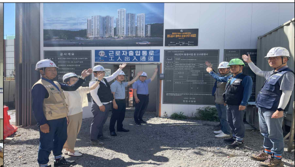
2024년 원도급·협력사 산업재해예방 상생 협약식(2차)