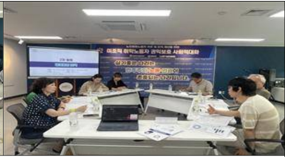
미조직 취약노동자 권익보호 사회적대화