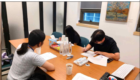
영세사업장 노동환경 실태조사