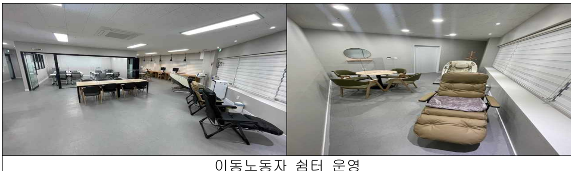
이동노동자 쉼터 운영