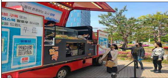
찾아가는 노동자상담센터 (푸드트럭)