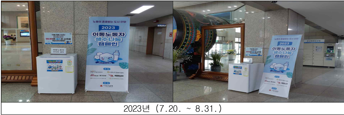
2023년 (7.20. ~ 8.31.)