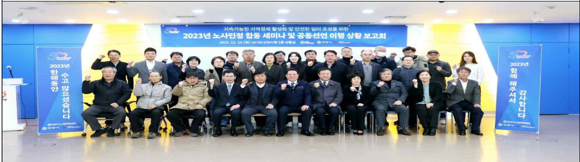
2023년 노사민정 합동 세미나 및 공동선언 이행상황 보고회