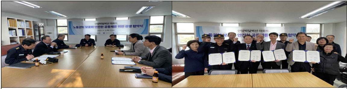
2023년 공동주택 상생 협약식