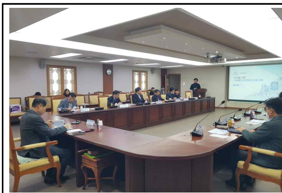
전문가 자문 및 중간보고회