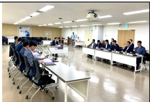
전문가 자문 및 완료보고회